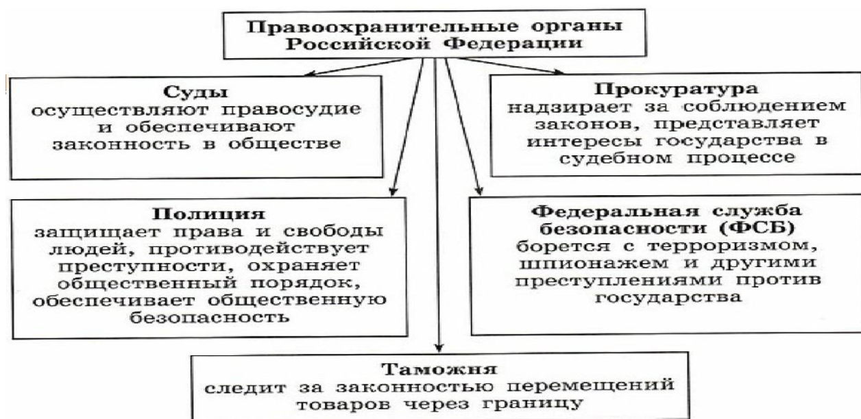
Рисунок 1 – Система правоохранительных органов Российской Федерации